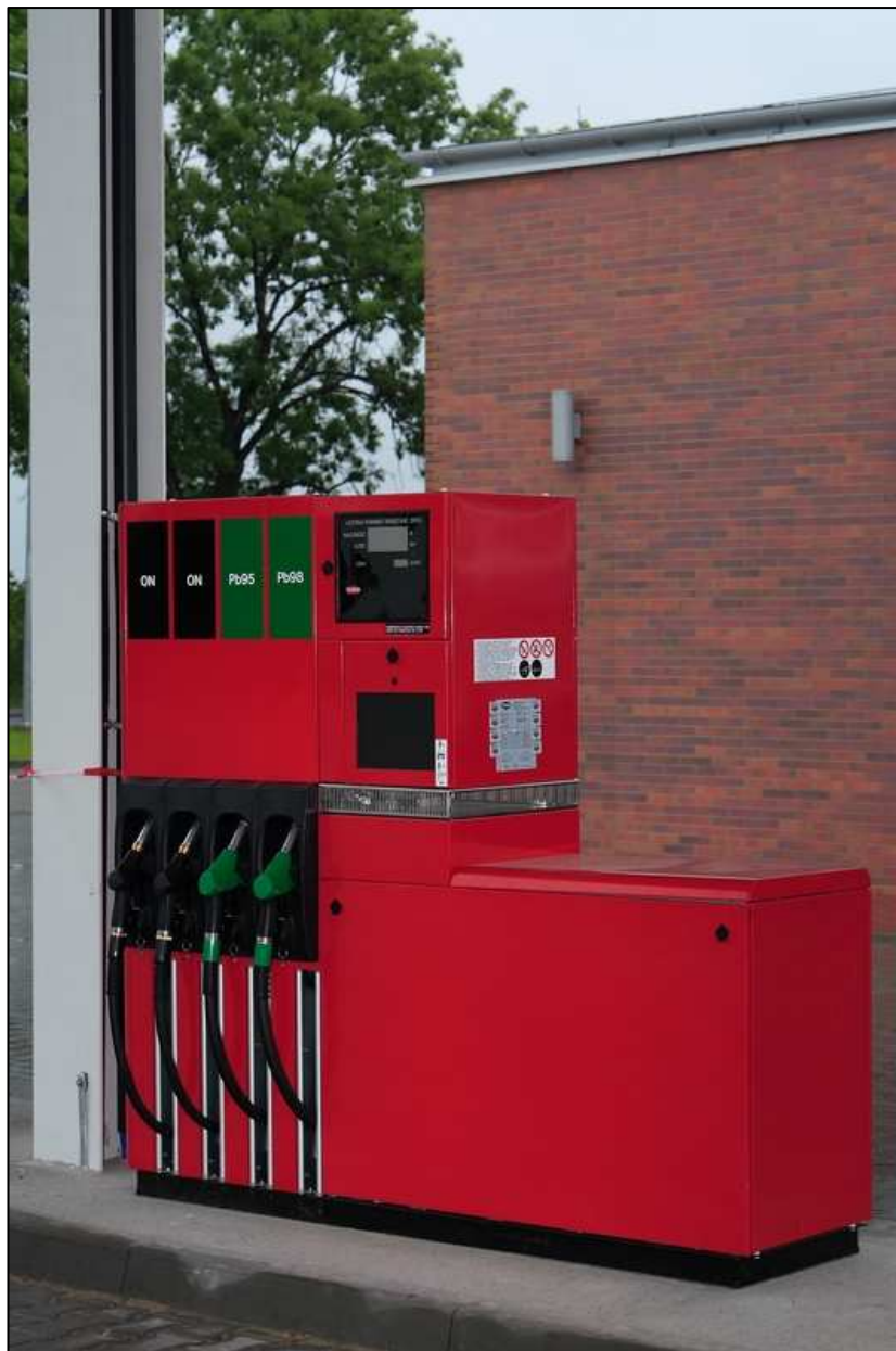
Odmierzacz multimedialny typ: Quantum 500T1 4-8