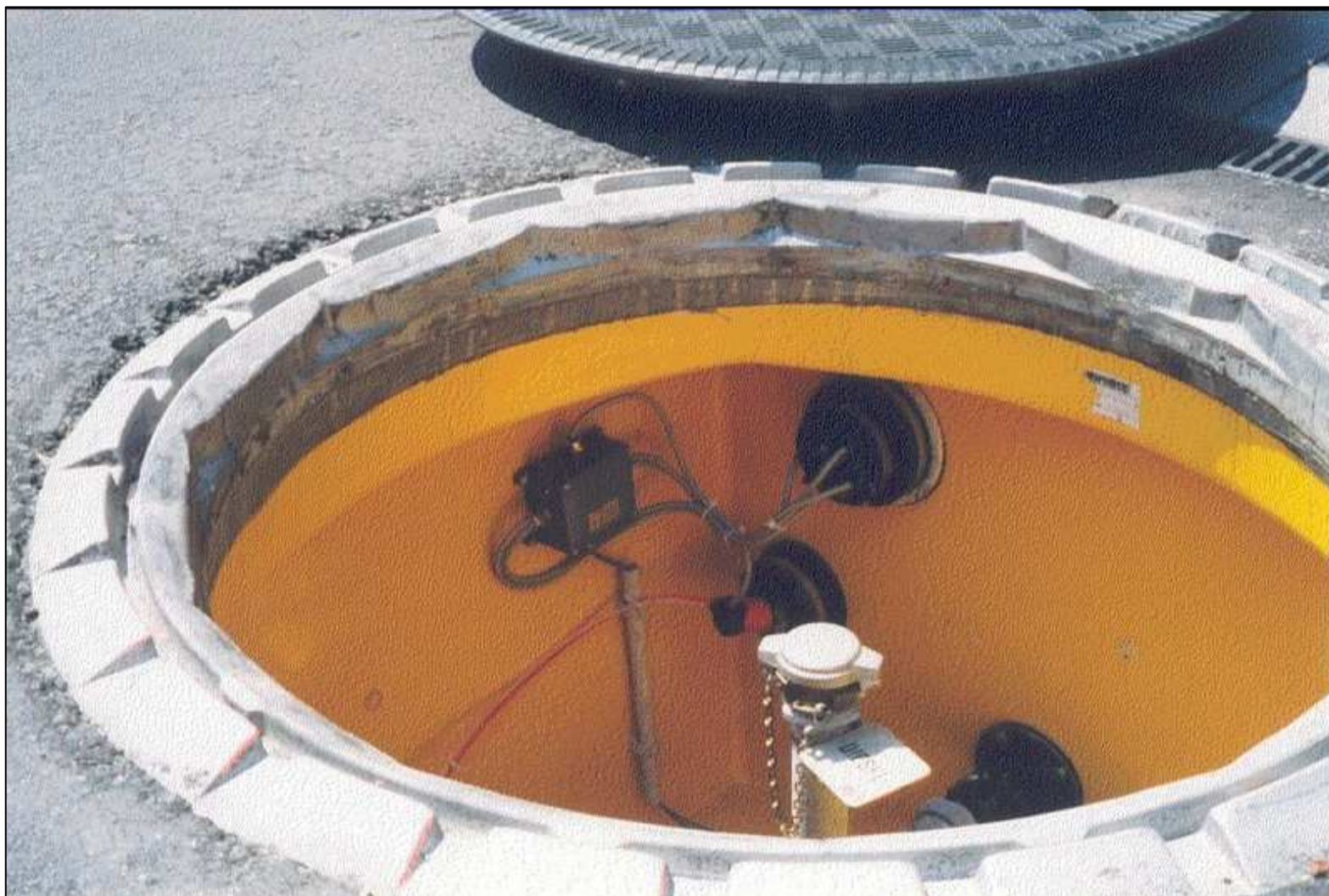
Studnia naziornikowa najazdowa Fibrelite wraz z pokrywą