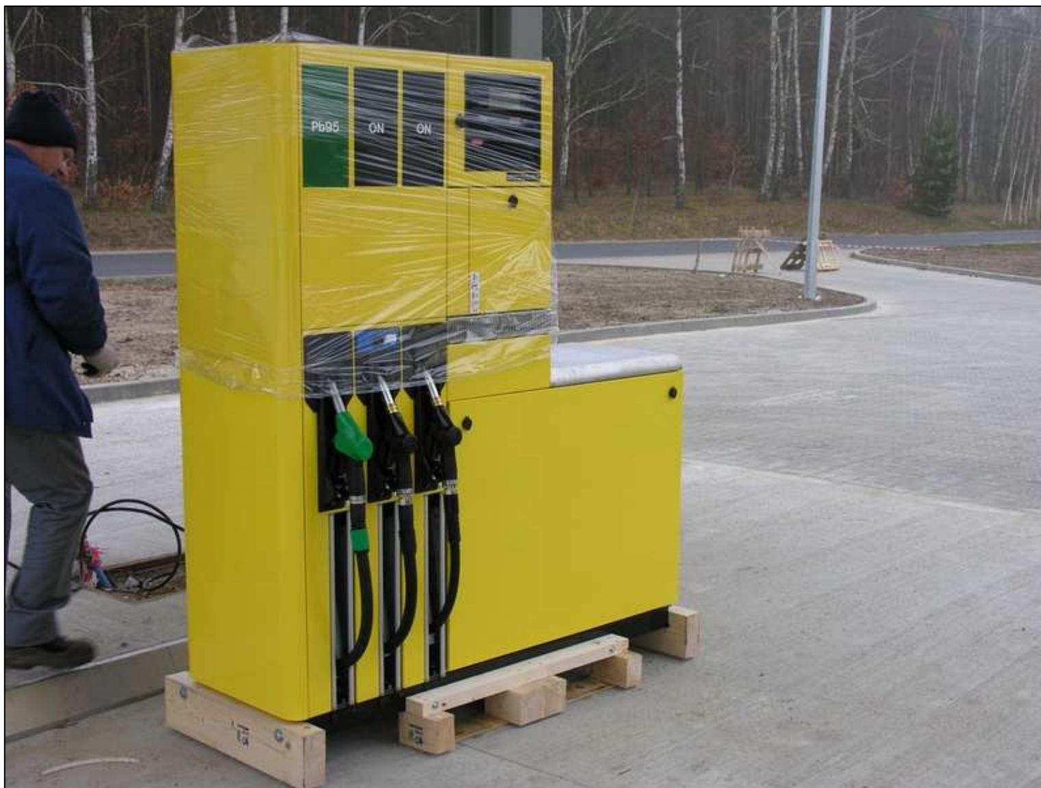
Transport odmierzacza typ: Quantum 500T1 HS 3-6