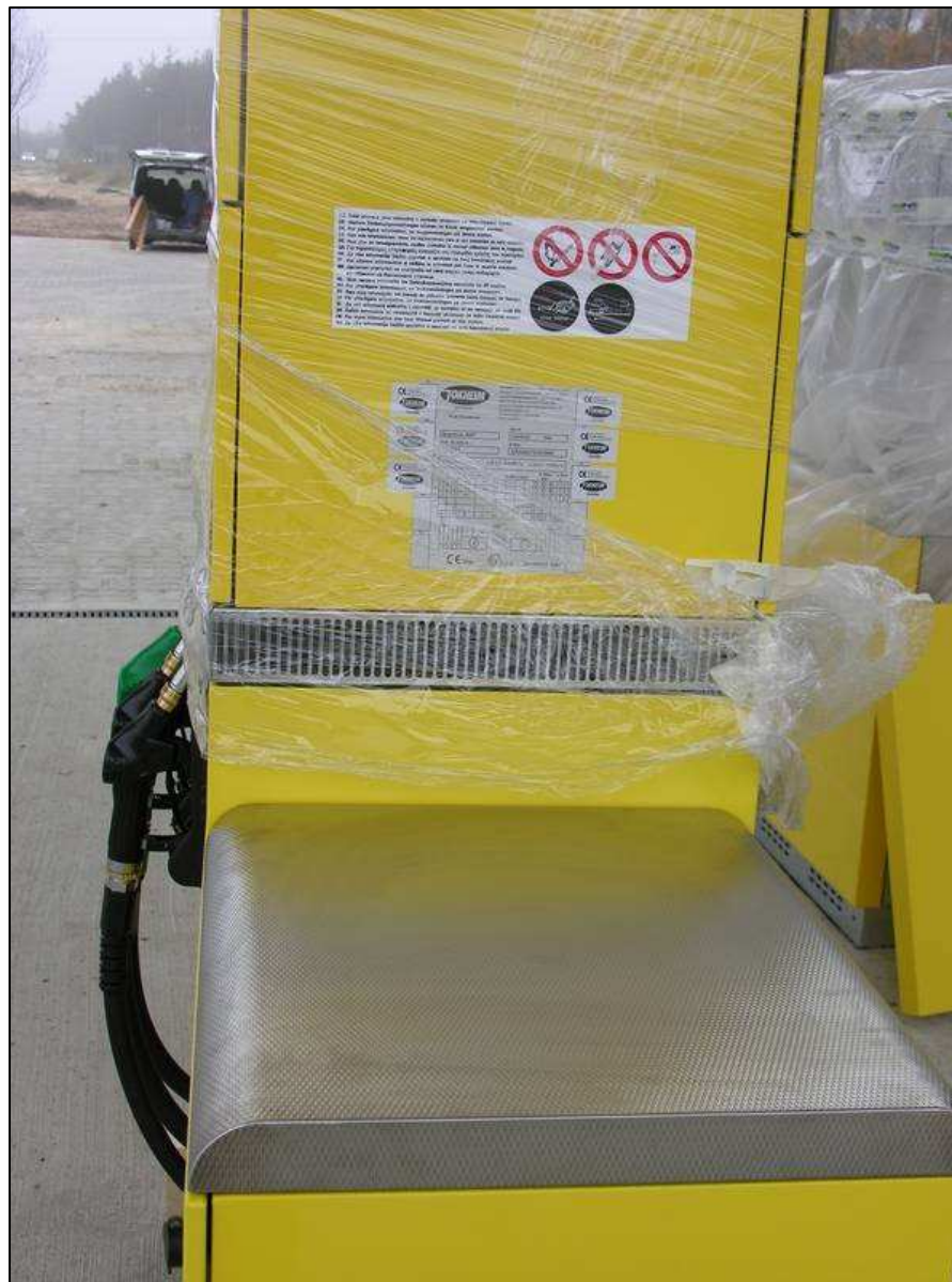
Panel hydrauliczny z perforowanej stali nierdzewnej (opcja)