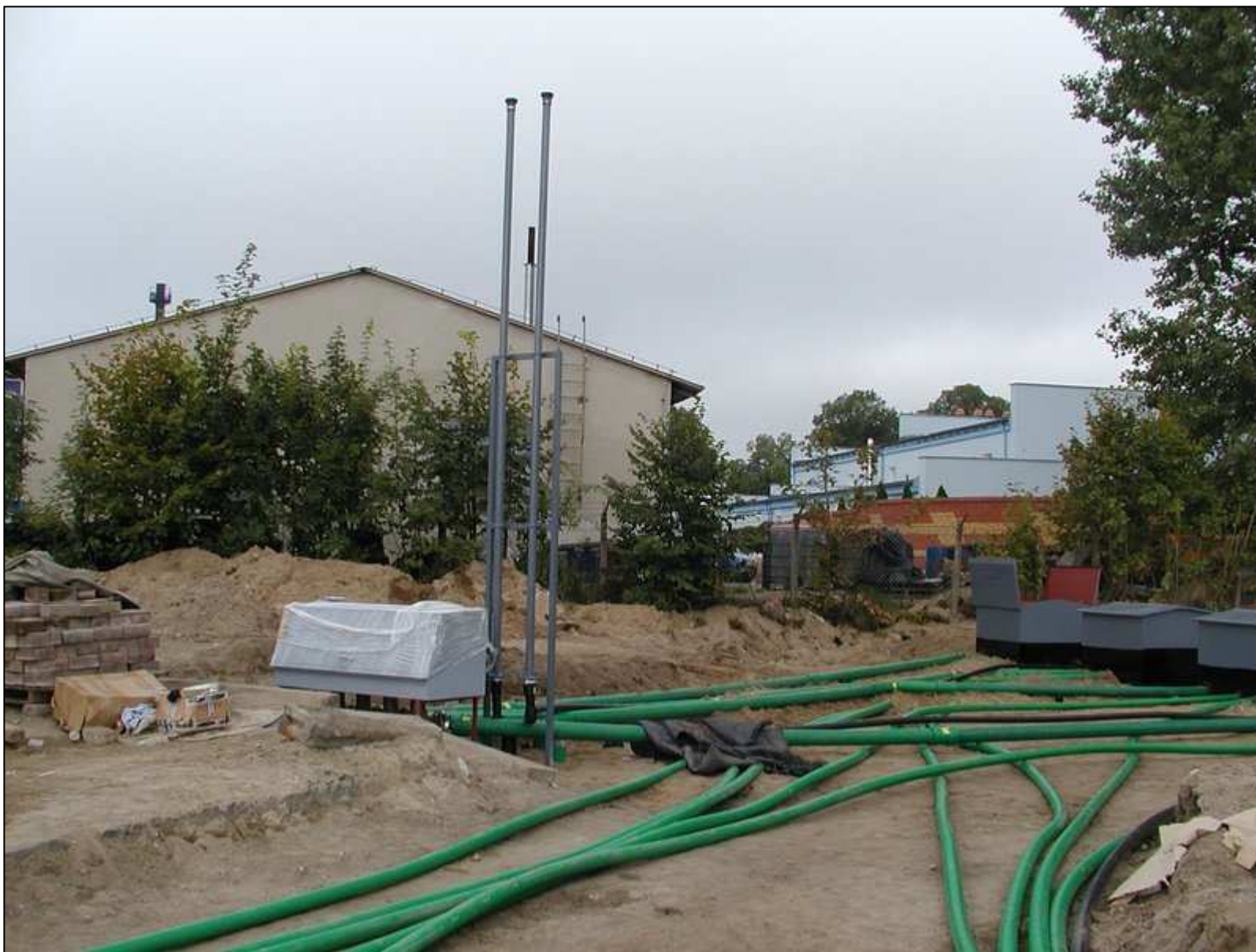
Instalacja paliwowa KPS Studzienka zlewowa z masztem oddechowym