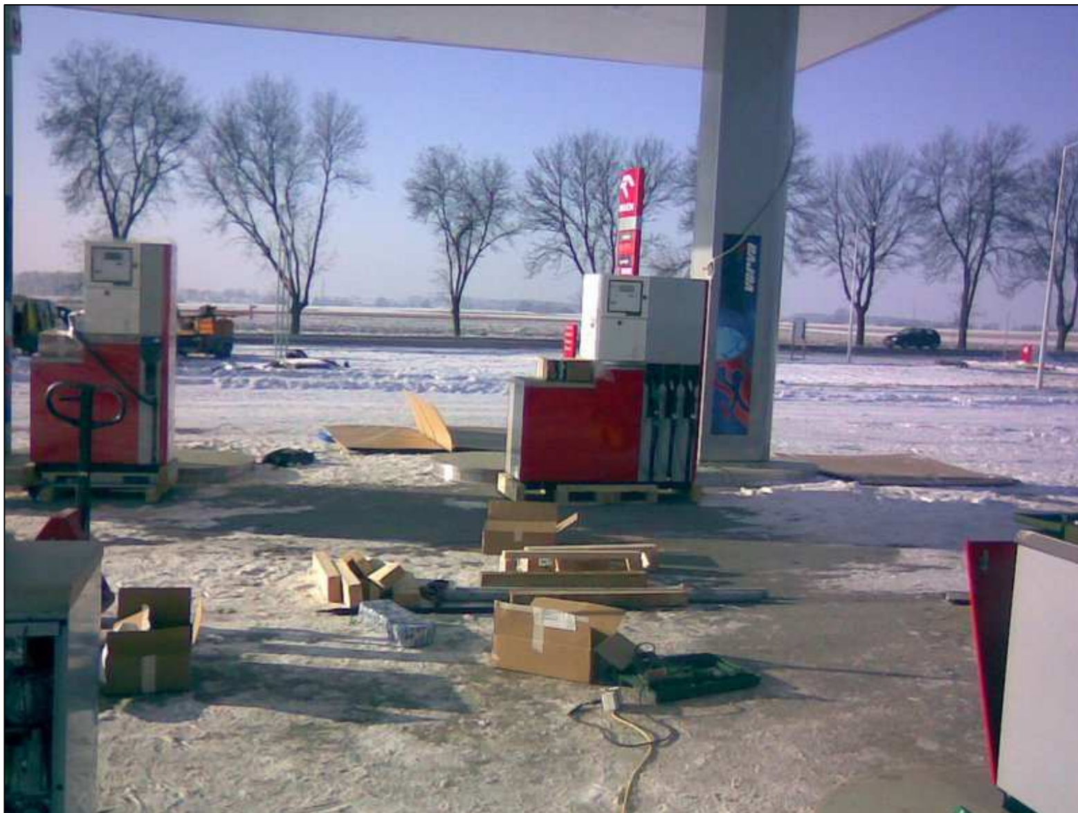
Montaż odmierzaczy na stacji paliw typ: Quantum 500T1 3-6