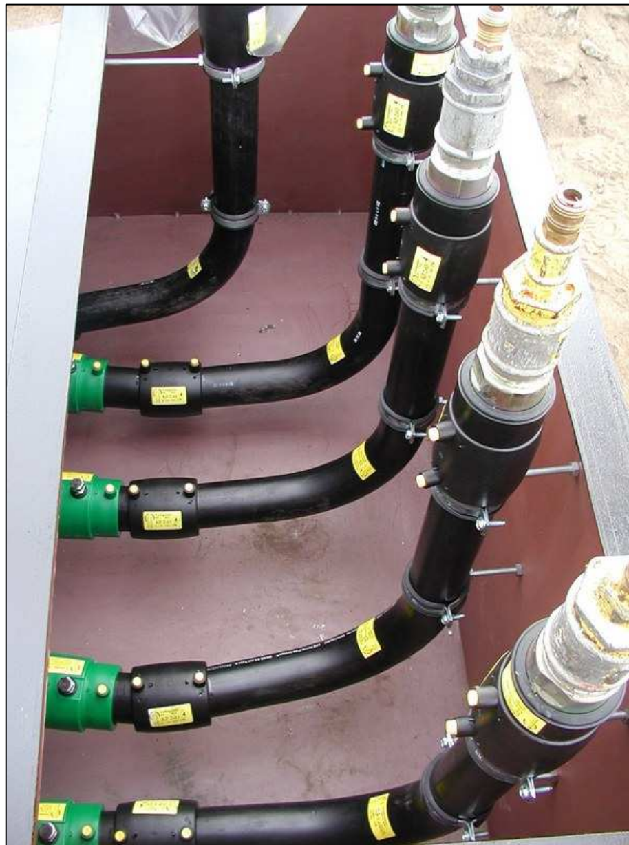
Instalacja paliwowa KPS Przyłącza instalacji do odmierzacza