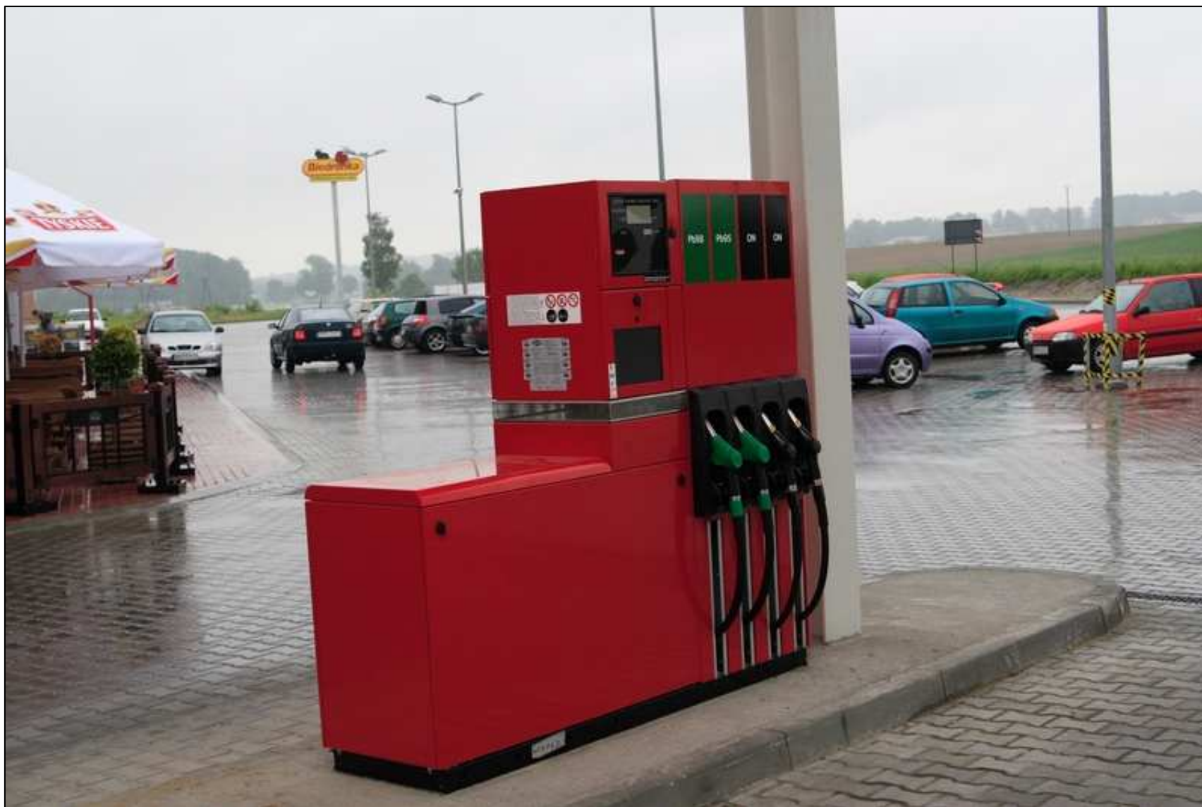
Odmierzacz multimedialny typ: Quantum 500T1 4-8