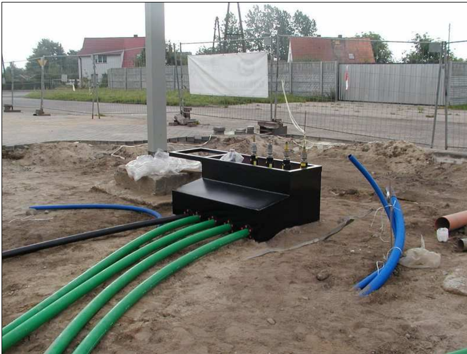
Instalacja paliwowa z rur podwójnych KPS podejście pod odmierzacz