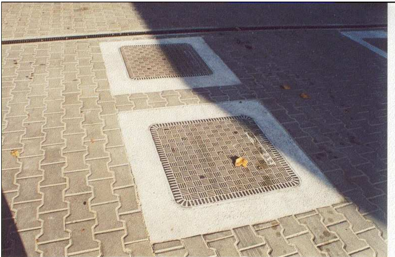
Pokrywa nazbiornikowa najazdowa Fibrelite typ: FL 76