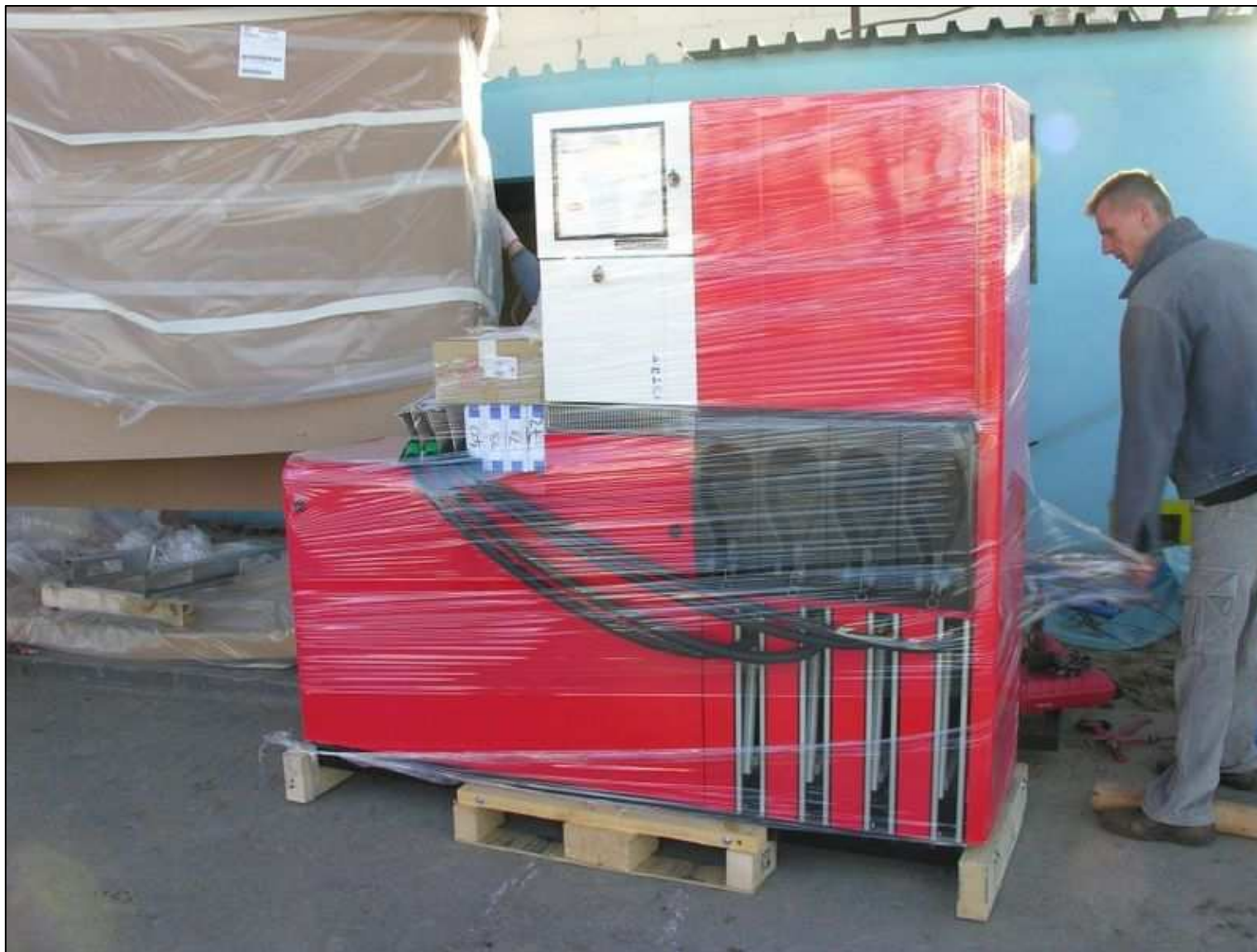
Dostawa odmierzacza na stację paliw (patronat Orlen) typ: Quantum 500T1 4-8