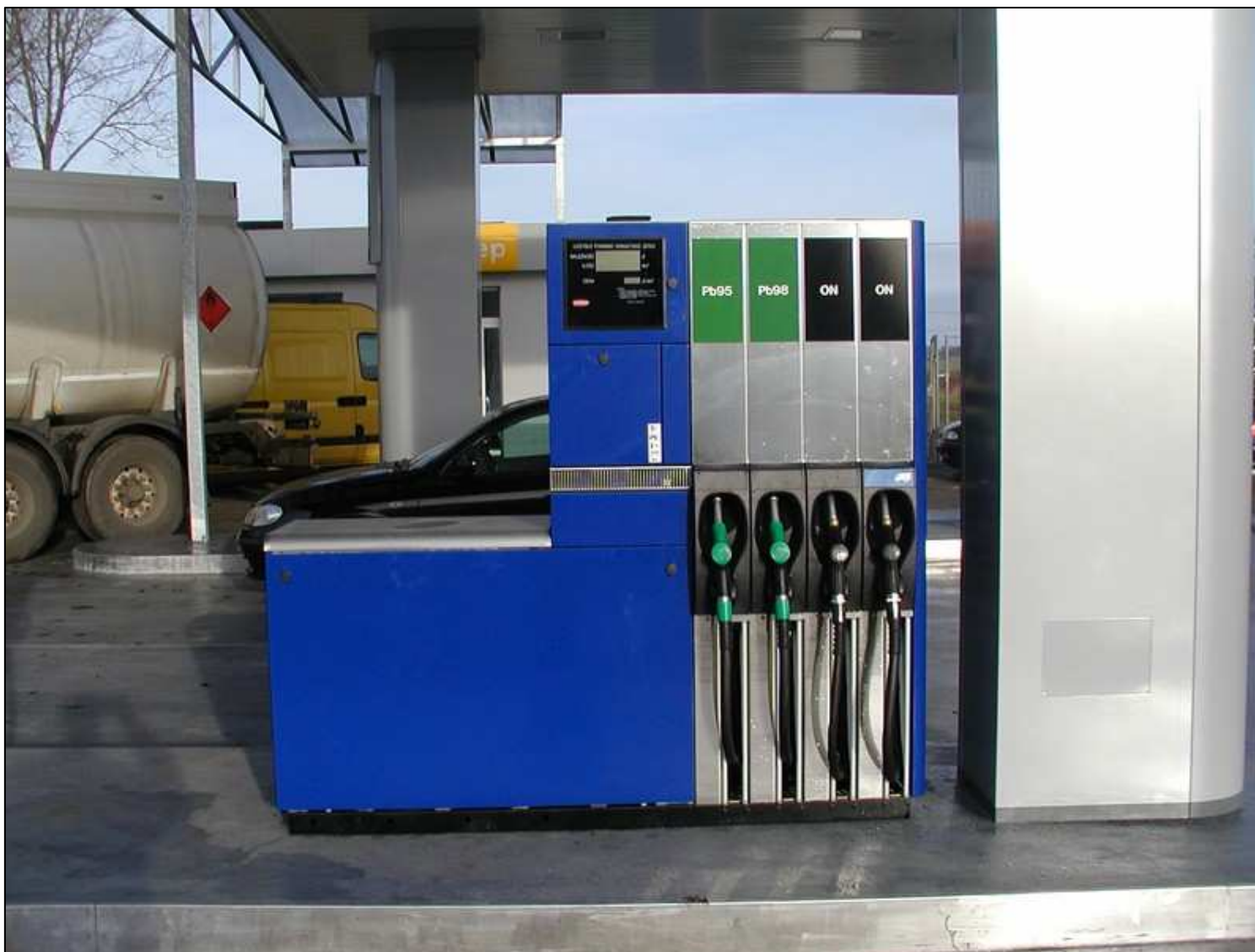
Wybrana kolorystyka odmierzacza typ: Quantum 500T1 4-8