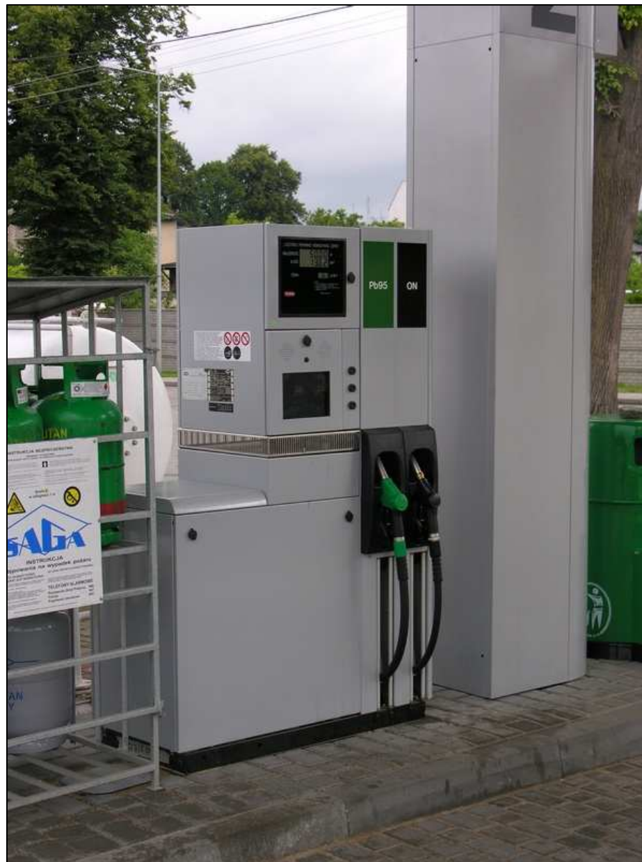
Odmierzacz multimedialny-rozwiązanie starsze typ: Quantum 500T1 2-4