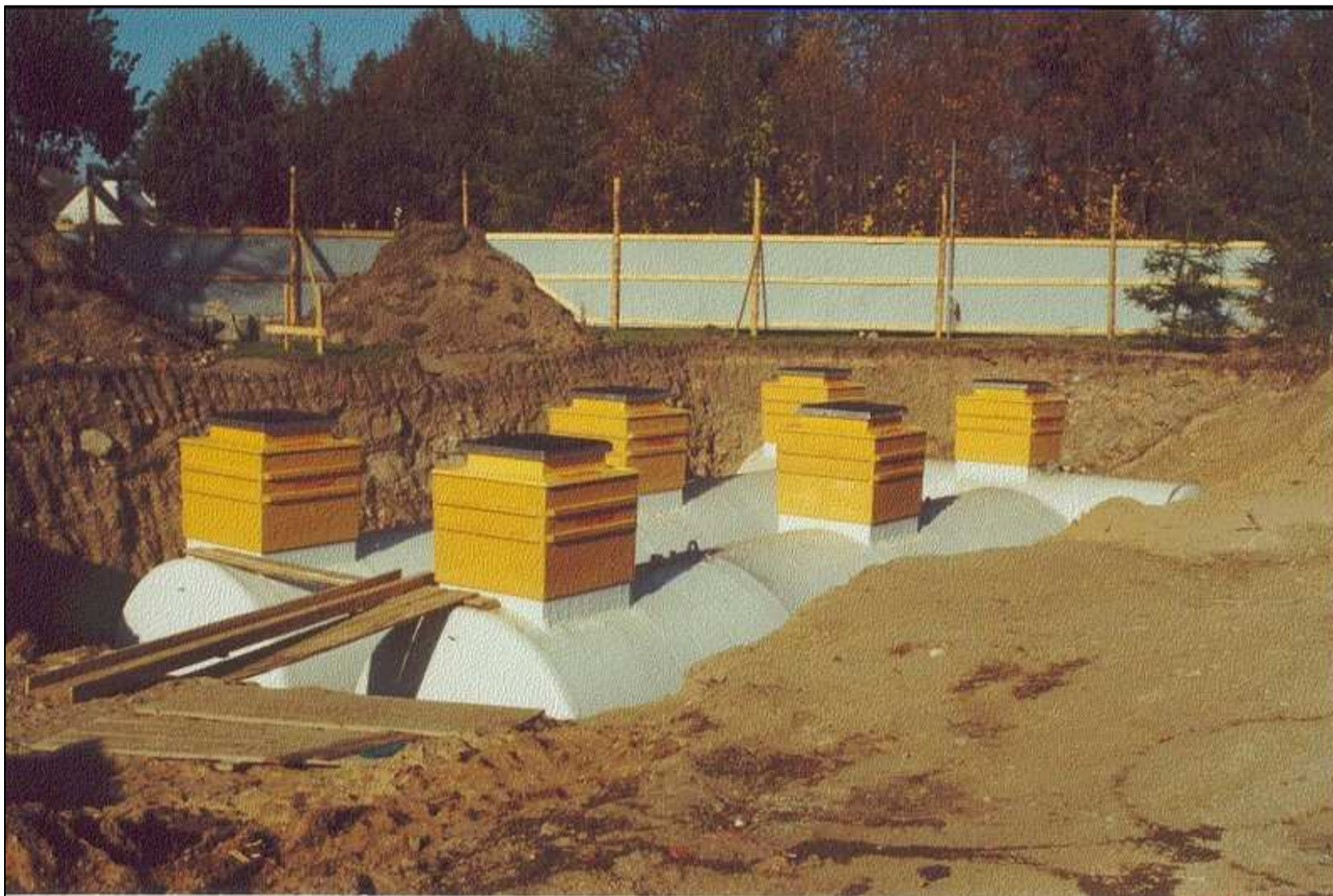
Studnie nazbiornikowe najzdowe Fibrelite zainstalowane na zbiornikach (przed zasypaniem)