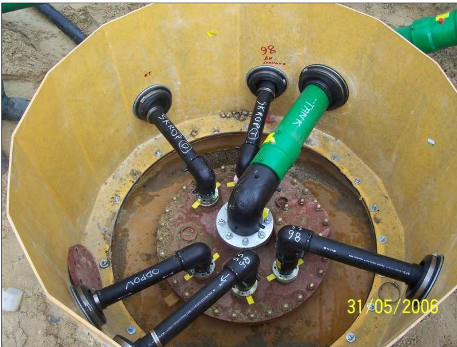
Instalacja paliwowa KPS Studzienka nazbiornikowa Fibrelite