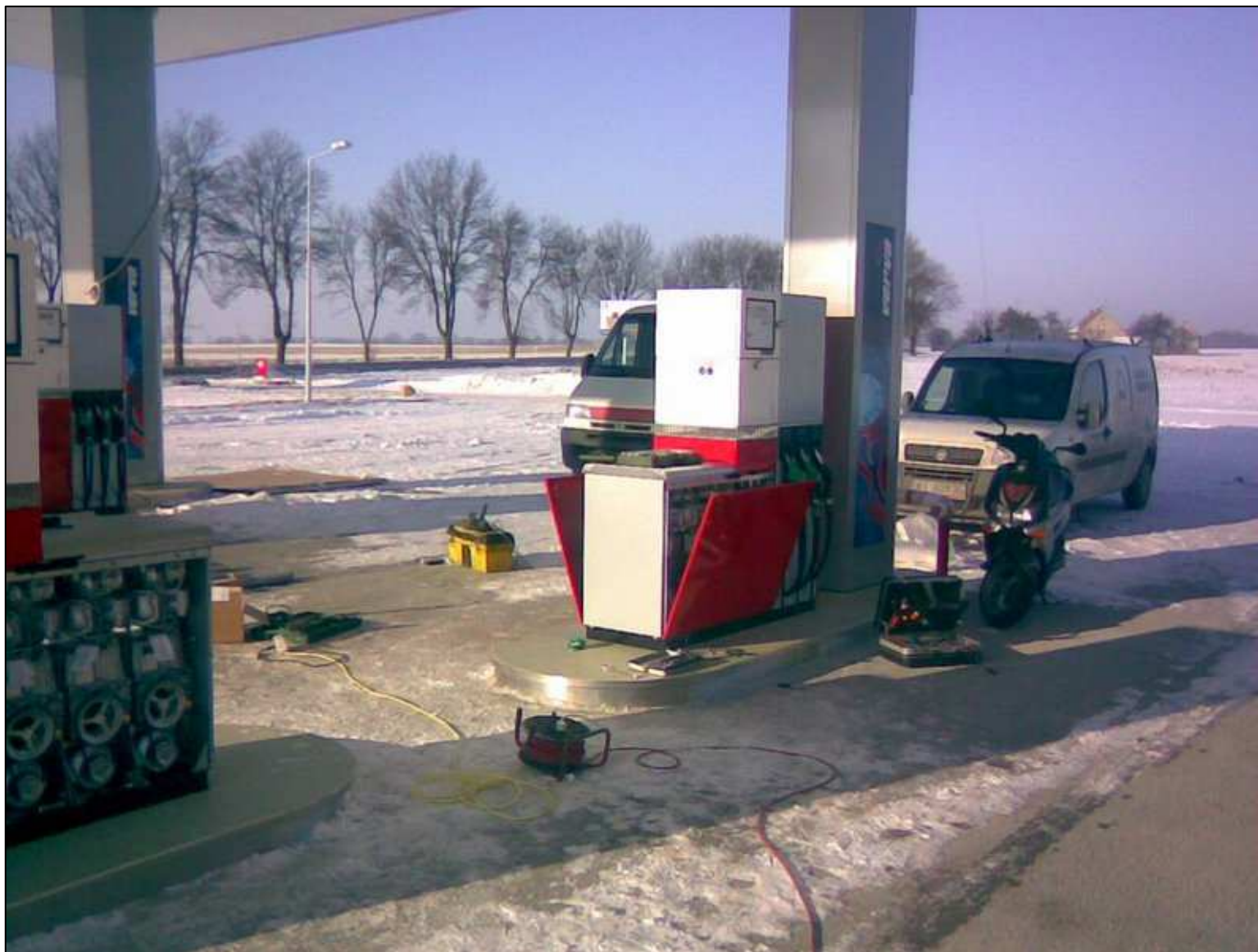
Montaż odmierzaczy na stacji paliw typ: Quantum 500T1 3-6