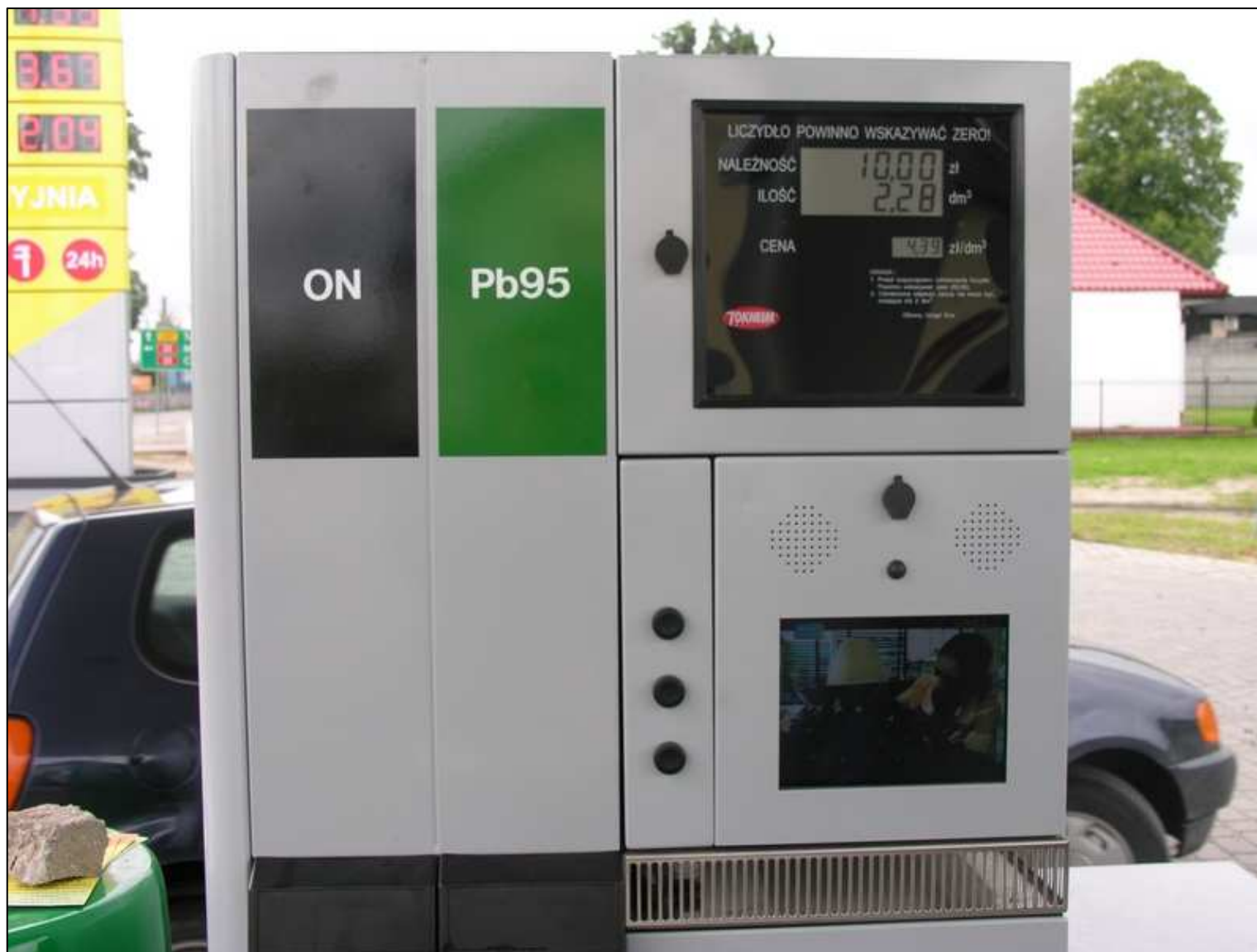
Odmierzacz multimedialny typ: Quantum 500T1 2-4