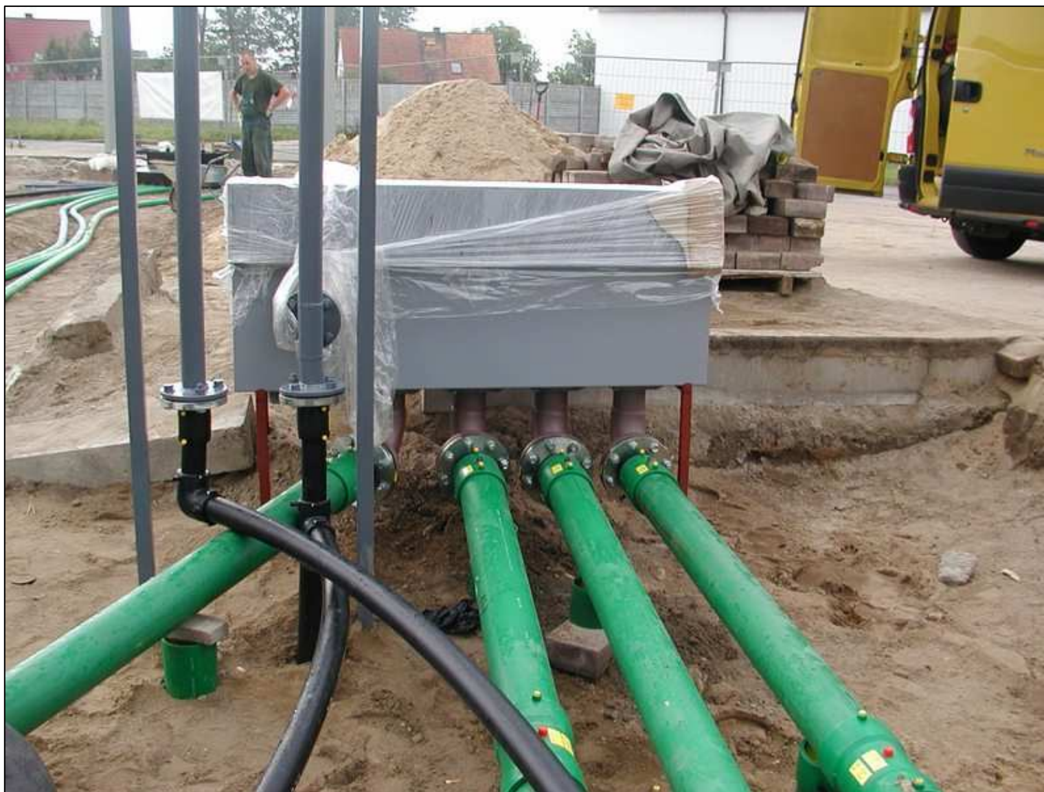
Instalacja paliwowa KPS Studzienka zlewowa wraz z instalacją zlewową