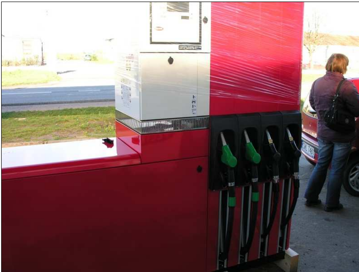
Dostawa odmierzaczy na stacji paliw typ: Quantum 500T1 4-8