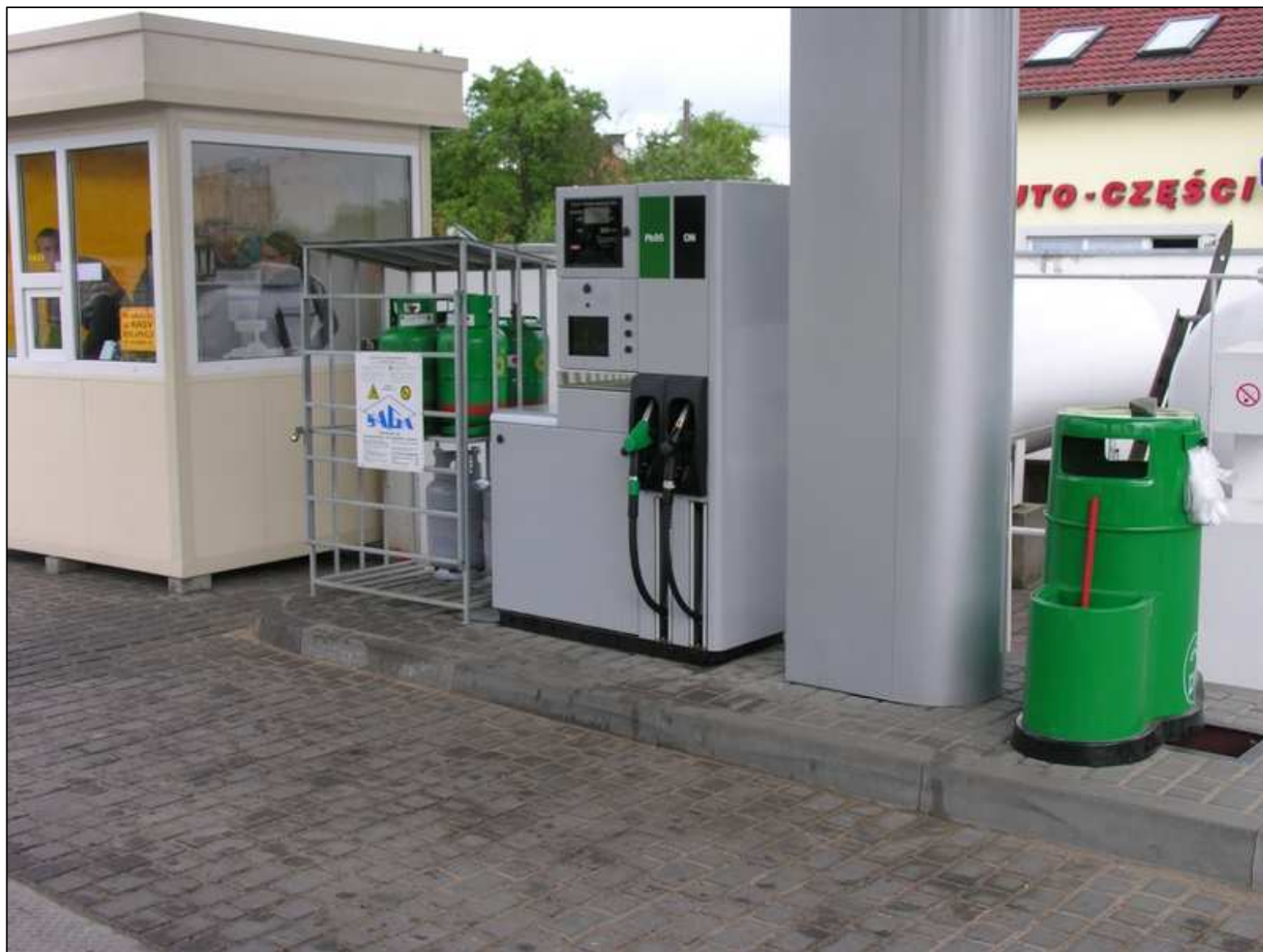
Odmierzacz multimedialny typ:Quantum 500T1 2-4