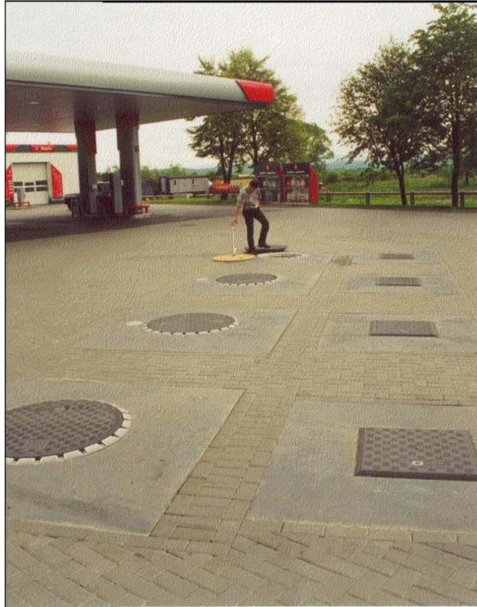
Pokrywy nazbiornikowe najzdowe typ: FL 36 (okrągła) oraz FL 10 (kwadratowa)