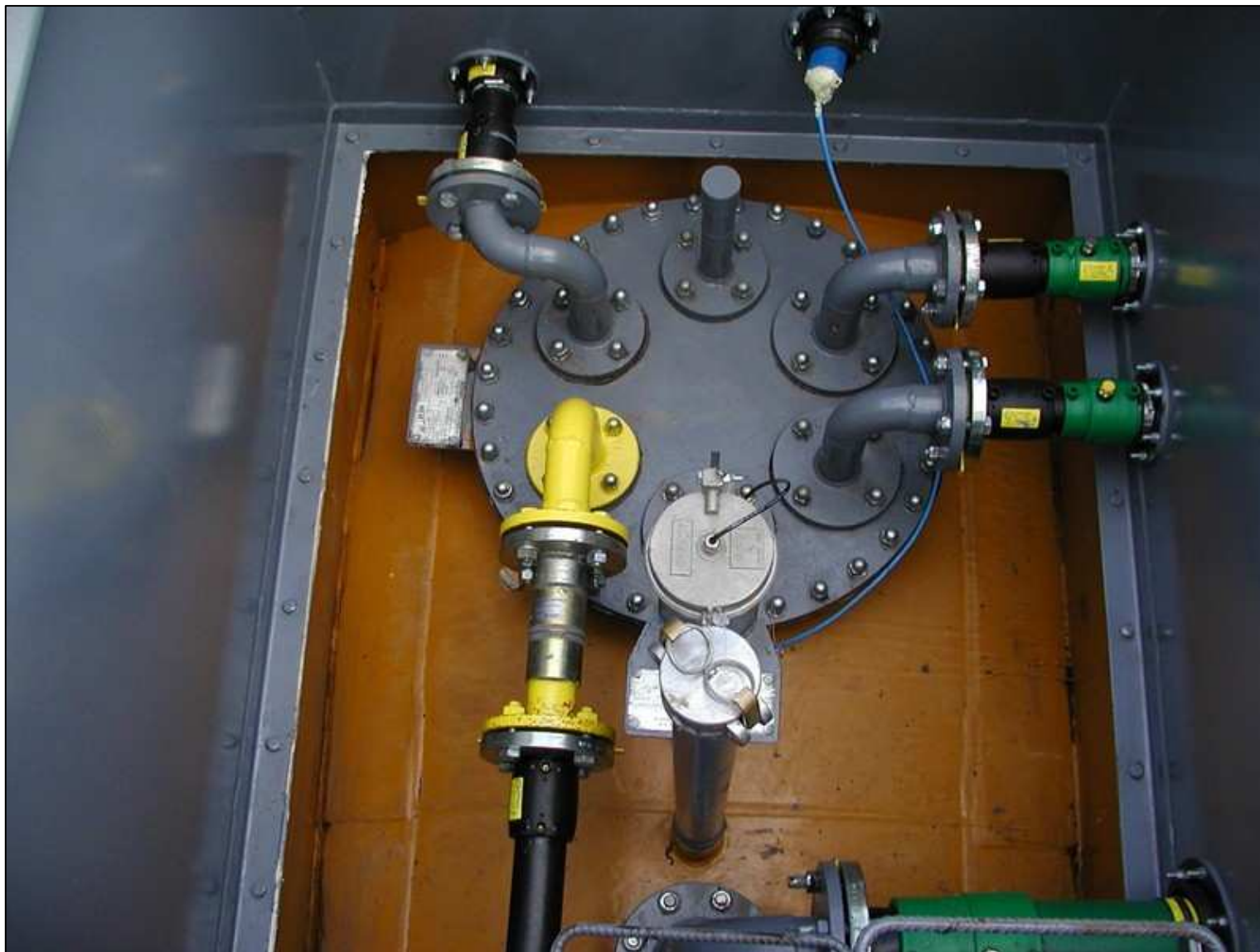
Instalacja paliwowa KPS Studnia nazdbiornikowa