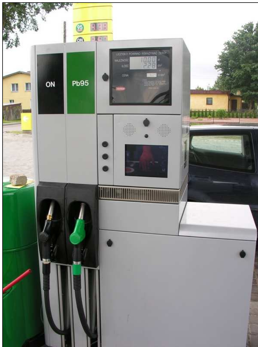
Odmierzacz multimedialny typ: Quantum 500T1 2-4