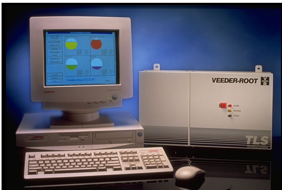
Rys.8 TLS350 PC z oprogramowaniem Inform