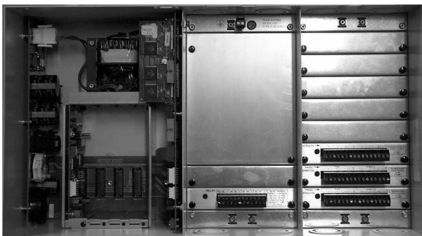
Rys.2 Widok centralki TLS350R po demontażu paneli zewnętrznych