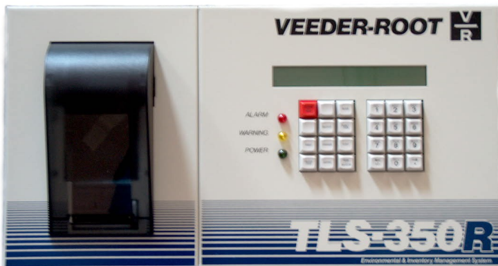
Rys.1 Widok centralki TLS350R w wersji z drukarką termiczną, klawiaturą i wyświetlaczem

Celem TLS350R jest pełne zautomatyzowanie procesów pomiaru, autokalibracji, rekoncyliacji, przyjmowania dostaw i testowania stanu systemu bez udziału czynnika ludzkiego co ma eliminować potencjalne błędy i manipulacje związane z kontrolą paliw. TLS-350R jest w pełni zintegrowanym systemem monitoringu paliwa oraz wykrywania wycieków. System został zaprojektowany w układzie modułarnym, dzięki czemu może on być dostosowany do wymogów każdej stacji, zmieniających się wymagań i przepisów oraz unowocześniany wraz z rozwojem technologii. Nowe funkcje mogą być dodawane poprzez zainstalowanie modułów do sterownika.